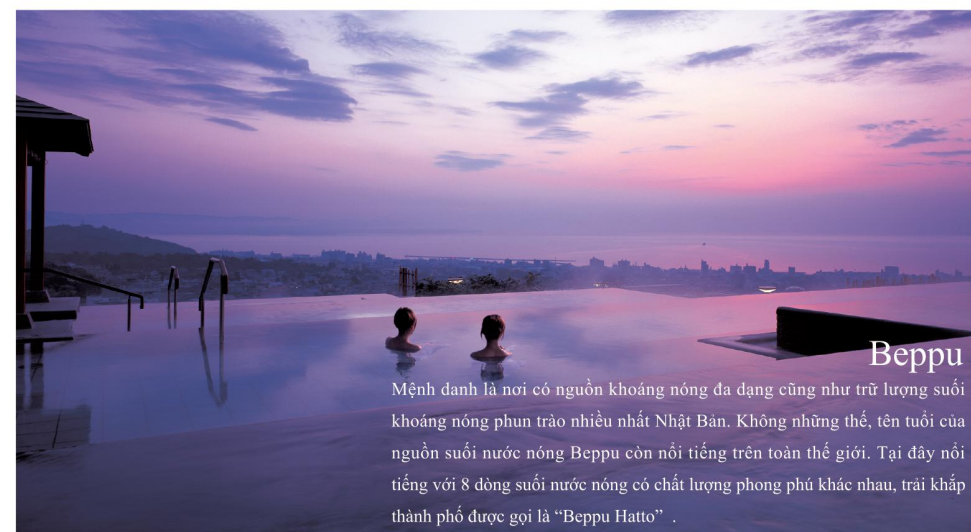
Beppu Mệnh danh là nơi có nguồn khoáng nóng đa dạng cũng như trữ lượng suối khoáng nóng phun trào nhiều nhất Nhật Bản. Không những thế, tên tuổi của nguồn suối nước nóng Beppu còn nổi tiếng trên toàn thế giới. Tại đây nổi tiếng với 8 dòng suối nước nóng có chất lượng phong phú khác nhau, trải khắp thành phố được gọi là "Beppu Hatto".